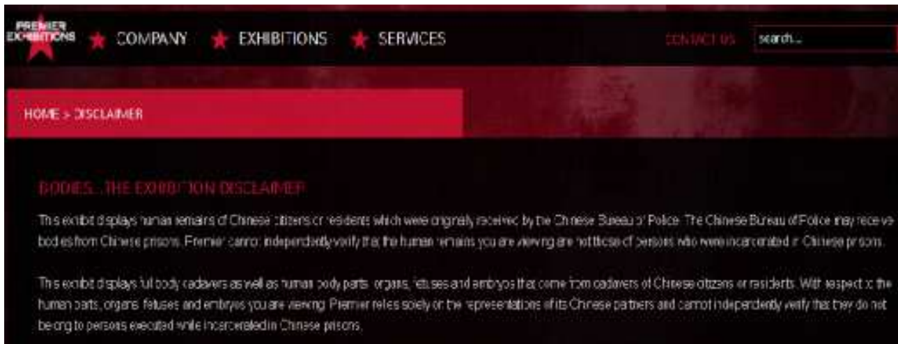
Imagen 11.7: Descargo de Responsabilidad de Premier Exhibitions

Los cadáveres usados en las exposiciones de cuerpos habían sido platinados antes de los dos días después de la muerte. Los cadáveres usados por Sui Hongjin no podían ser cadáveres indocumentados. En Agosto de 2012, Sui Hongjin coincidió [con esto] en el Southern Metropolis Daily: “Desde el primer día en que fue fundada Dalian Hongfeng, ningún espécimen plastinado ha provenido del corredor de la muerte, ninguno” y “Hasta el momento, ninguno de nuestros especímenes humanos plastinados proviene de donantes”. “Proviene de gente que ha muerto en el hospital y nadie ha reclamado el cuerpo.”