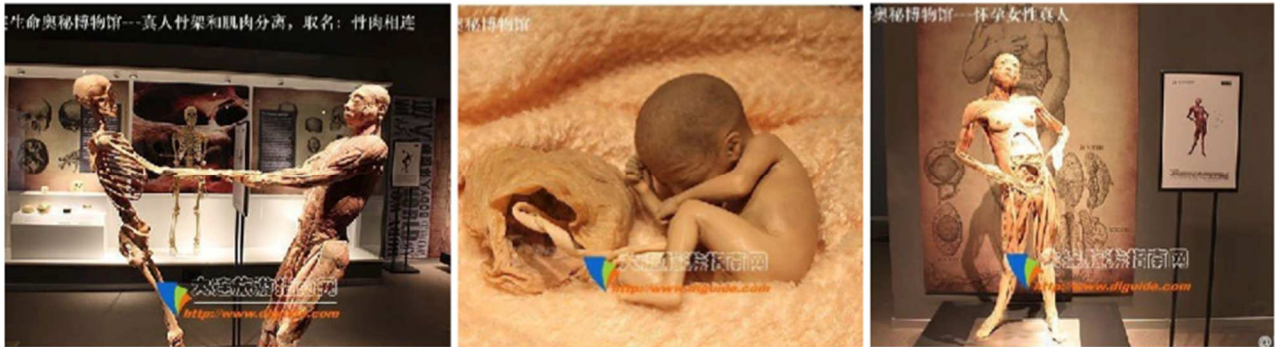
Figura 11.8: Parte de la exposición de Dalian Hongfeng "Museo del Misterio de la Vida": Especímenes de Los Amantes, Feto en el Vientre y Madre y Bebés Siameses.

Hongfeng Biological Technology Co., Ltd. tiene negocios con más de 100 museos mundialmente famosos y sus ingresos anuales han superado los 200 millones de yuanes.